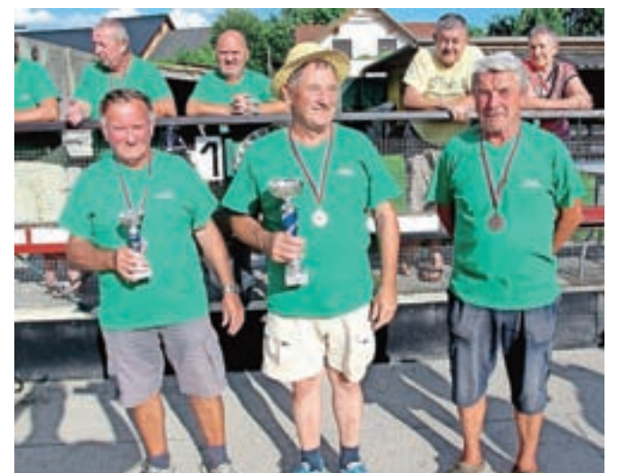
Najboljši balinarji Pod Jenkovo lipo