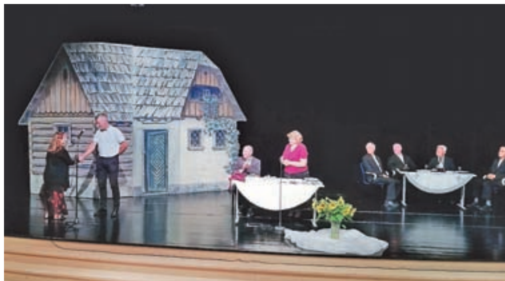
Na večeru, posvečenem Petru Pavlu Glavarju

V ponedeljek, 20. septembra, je potekal tudi Hribarjev večer, na katerem smo se spomnili legendarnega ljubljanskega župana, politika,