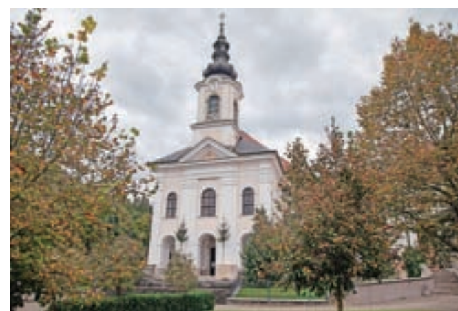
Cerkve Marijinega oznanjenja

Občina preko Zavoda za varstvo kulturne dediščine Slovenije vodi postopek za zaščito samostana Velesovo in cerkve Marijinega oznanjenja