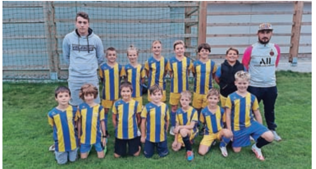
V Velesovem veliko pozornosti namenjajo mlajšim selekcijam.

Za konec želimo še enkrat povabiti vse otroke, ki jih zanima nogometna žoga in ki