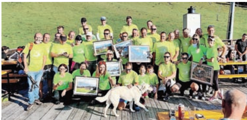
Tokratni junaki Krvavca

Začela se je že tudi sedma akcija Junaki Krvavca, ki bo potekala do 24. septembra prihodnje leto. Vsi, ki bi radi sodelovali, se lahko vpišete v Brunarici Sonček. Junaki Krvavca 2022 bodo postali vsi, ki bodo opravili več kot 52 vzponov na Krvavec in se vpisali v knjigo v Brunarici Sonček. Na dan je možen samo en vpis.