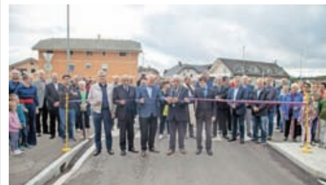
Odprtje krožišča na Trati. Odprtja druge komunalne infrastrukture je preprečila epidemija covid-19.