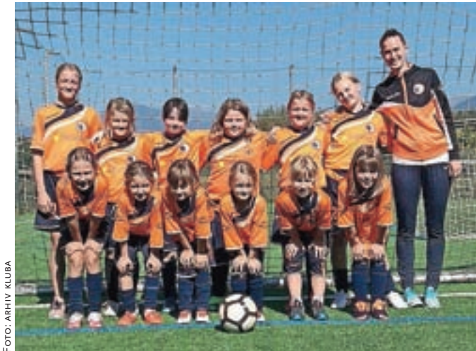
V klubu trenirajo deklice od petega leta starosti dalje.

Velesovo – Veseli smo, da se šport, kljub nekaj omejitvam, vrača na stare tirnice. Vsa dekleta se približno trikrat tedensko udeležujejo treningov ter ob koncu tednov tekmujejo na tekmah in turnirjih. V tekmovalni sezoni 2021/22 so dekleta od trinajstega leta dalje vključena v tekmovanja, ki se odvijajo pod okriljem Nogometne zveze Slovenije, mlajša pa so v tekmovanja in turnirje Medobčinske nogometne zveze Gorenjske – Kranj. Dekleta, ki nastopajo v kategorijah U15 in U17, so v sezono zakorakale z odličnimi rezultati, tudi pri članih se kaže napredek, kar se kaže v dobrih rezultatih. V mlajših selekcijah so tekme in turnirji le formalnost. Za razvoj ženskega nogometa in naših igralk je pomembno, da se osredotočimo na napredek vsake posamezni-