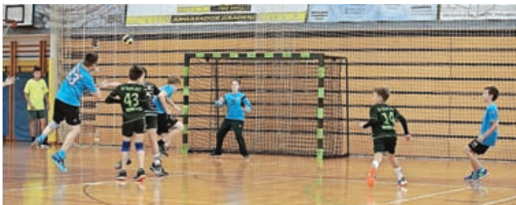
Cerkljanski rokometiški »v pogonu«

Sezona 2020/21 je bila zaradi epidemije okrnjena. Začela se je septembra 2020 in bila prekinjena že v oktobru, prekinitev pa je trajala vse do marca 2021. Treninge smo lahko nadaljevali 15. februarja, tekmovanja pa v aprilu in zaključili v juniju 2021.