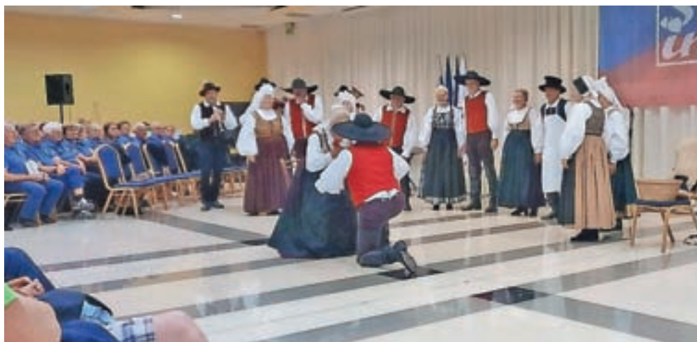
Cerkljanski folklorniki med nastopom

V Kulturnem društvu Folklor Cerklje vabijo v svoje vrste nove člane, tako upokoence kot tudi mlajše. Informacije dobite na telefonski številki 031 791 870 (Irena Naglič).