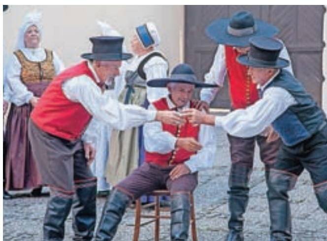
Pestro Hribarjevo popoldne

ča nit so bile zgodbe iz njegovega življenja v interpretaciji članic trzinskega pevskega zbora, preko katerih so si lahko obiskovalci, ki so prisluhnili programu, ustvarili jasnejšo podobo človeka, ki je pečat pustil tudi v Cerkljah. Nastopili so tudi pevci skupine Klasje, za dobro razpoloženje pa so poskrbeli še ljudski godci in člani cerkljanske folklorne skupine.