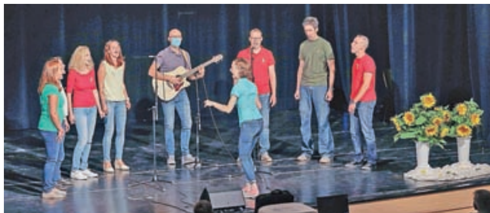
Na koncertu se je predstavilo petdeset nastopajočih, med njimi šest Junakov.

Vsi, ki so se ali se zdravijo na hemato-onkološkem oddelku Pediatrične klinike, imajo za seboj neprijetne izkušnje, a kljub temu osta-