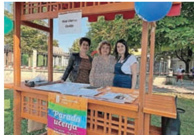
Na letošnji paradi učenja

Vse te spomine smo kot ureničevalci kulture odstrli v projektu Slovenija, moja nova država ob dnevu učečih se skupnosti na Paradi učenja 2021 v Kranju v sre-